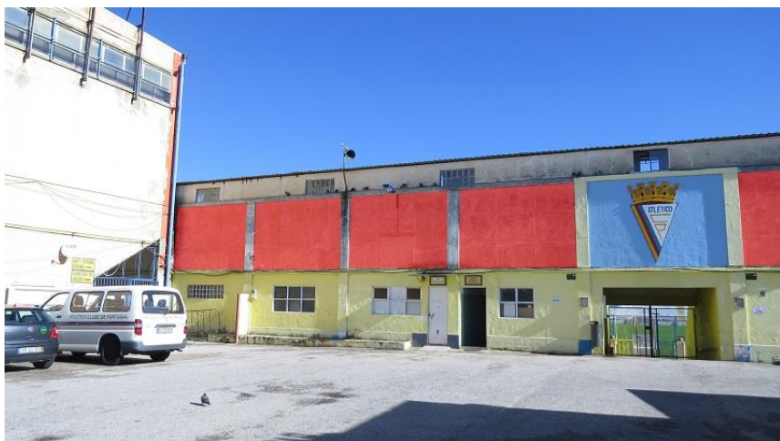
LONAS DE 3M POR 2M ENTRADA PRINCIPAL DO ESTÁDIO