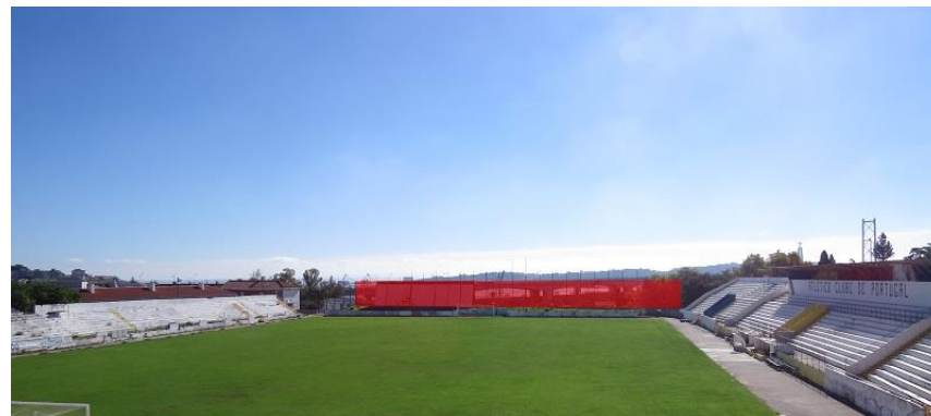
OUTDOOR VISÍVEL NA ZONA SUL