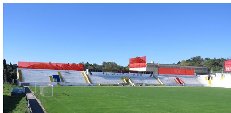
CAPACIDADE PARA 2 OUTDOORS NA ZONA ESTE DO ESTÁDIO