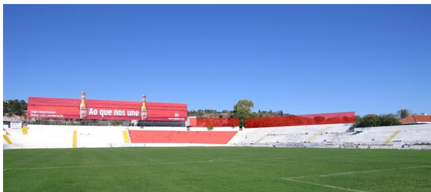
TELA MICRO-PERFURADA PARA COBERTURA DE BANCADA