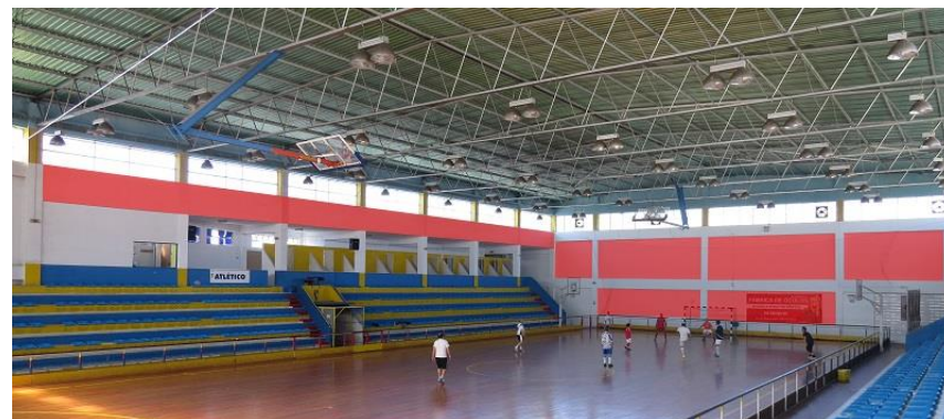
TELAS ATRÁS DA BALIZA