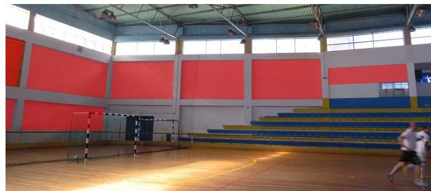
TELAS 4M POR 2,15M